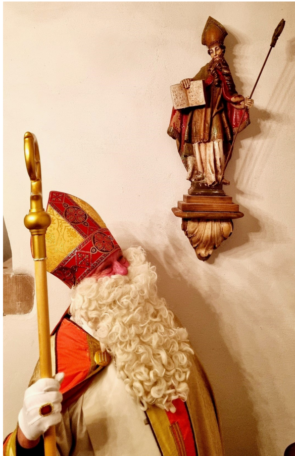
Nikolaus (Diakon Voß) trifft Nikolaus in St. Nikolaus in Westhoven